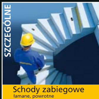
Schody zabiegowe lamane, powrotne

■ Poprzez zastosowanie naszego elementu macie Państwo możliwość swobodnego planowania, ponieważ inteligentna produkcja umożliwia wykonanie 14 tys. różnych wariantów schodów. Schody produkowane są we własnych, dostosowanych do typu formach.