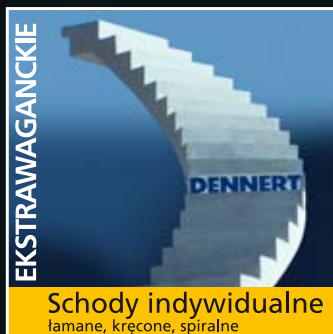
Schody indywidualne lamane, kręcone, spiralne

■ Schody są już w fabryce optymalnie przygotowane do późniejszego zastosowania. Zaliczają się do tego: doskonałe parametry akustyczne, powierzchnie spodnie nadające się do tapetowania, wyrównane stopnice, wbudowane kotwy z gwintem lub bez w celu przymocowania balustrady.