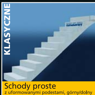
Schody proste z uformowanymi podestami, górny/dolny